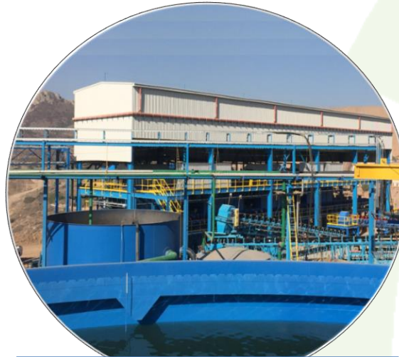
Polymetallic Tails 5000 tpd