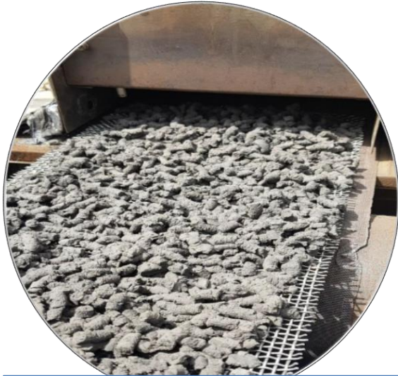
Polymetallic concentrate residual moisture adjustment