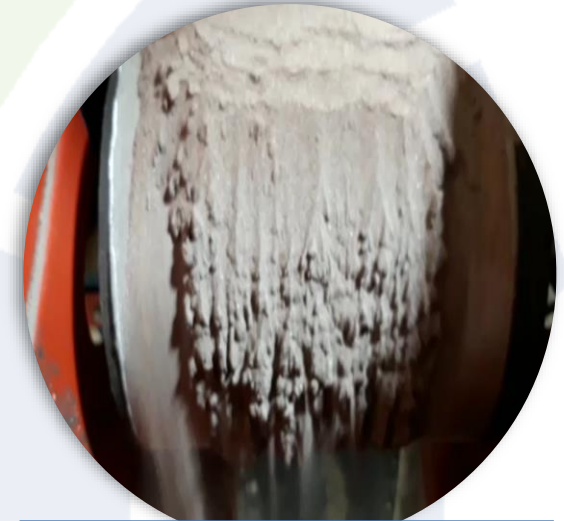
Mineral Sands Drying <1% residual moisture