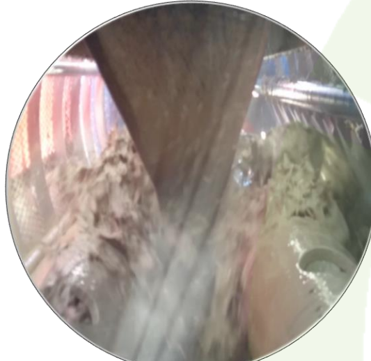
Classification Screen 100 \mu