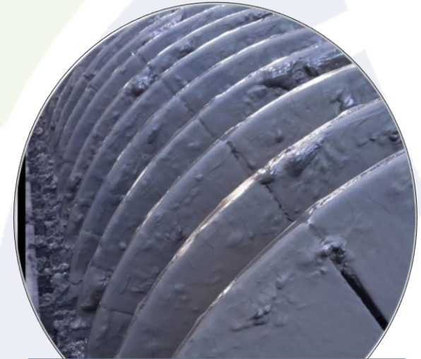
Copper Concentrate P80 44 \mu